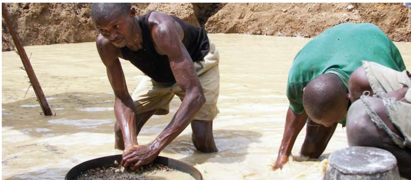
Diamantenschürfer in Kono, Sierra Leone

Von der Fastenzeit bis in den Spätsommer 2010 zeigte das Ökumenische Netzwerk Rohstoffgerechtigkeit unter der Federführung von Pax Christi Limburg eine Fotoausstellung des Bonner Konversionszentrums (BICC) zur Bedeutung von Rohstoffen für die wirtschaftliche und soziale Entwicklung unserer Welt. Gemessen an der Zahl der Besucherinnen und Besucher war die Ausstellung ein großer Erfolg. Die Probleme aber bleiben bestehen.