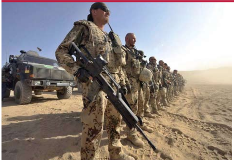
Bundeswehrosoldaten in Afghanistan: Die »vitalen Interessen« Deutschlands fest im Blick?

Birgit Wehner Sprecherin von Pax Christi Limburg