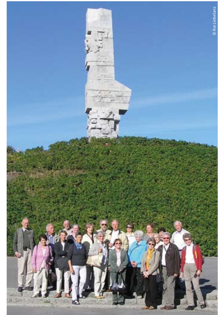
Die Reisegruppe der Gedenkfahrt vor dem »Denkmal der Küstenverteidiger« auf der Westerplatte. Das im Jahr 1966 aus 224 Granitblöcken errichtete Mahnmahl erinnert an alle polnischen Soldaten, die hier und an den anderen Fronten im Zweiten Weltkrieg ihr Leben ließen.

Wir standen am Frischen Haff und blickten nach Gotenhafen, vor uns die Ostsee, die zum Grab für Tausende Flüchtlinge wurde. In der Wolfsschanze, dem erhofften Bollwerk Hitlers gegen den Osten, war die Menschenverachtung der Nationalsozialisten besonders greifbar. Bunker, die eine zehn Meter dicke Stahlbetondecke haben, um die eigene Sicherheit zu gewähren, und ein paar Kilometer weiter das Konzentrationslager Stutthof. Unser Be-