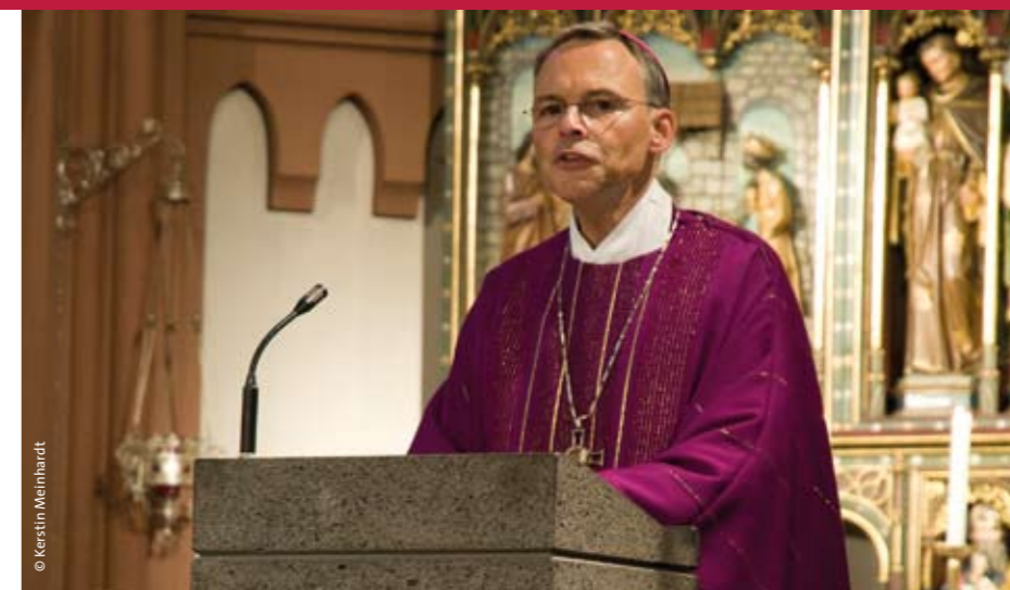
Predigt von Bischof Franz-Peter Tebartz-van Elst