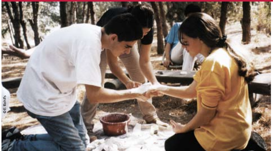
Dem Herzen folgen und Grenzen überwinden: Israelische und palästinensische Jugendliche stellen bei einem internationalen Workshop des Willy-Brandt-Zentrums in Jerusalem Abdrücke ihrer verbundenen Hände als Versöhnungsgeste her