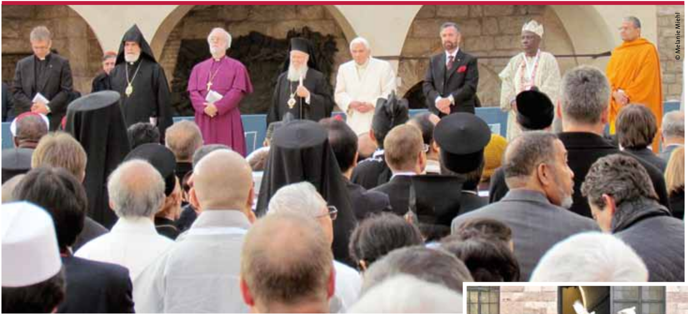
Wertlose Inszenierung oder wichtiges Zeichen? Vertreter verschiedener Religionen beim Interreligiösen Gebet für den Frieden am 27. Oktober in Assisi.