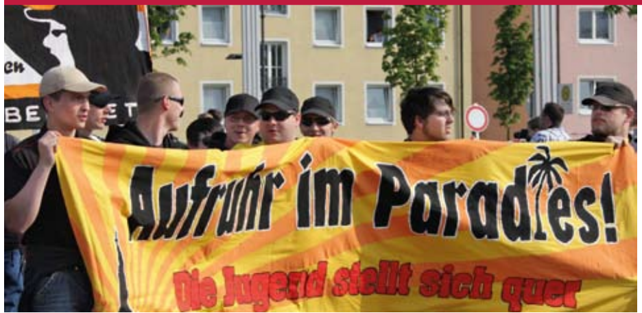
Neonazi-Aufmarsch in Ulm am 1. Mai 2009: Das fröhliche gelbe Banner darf nicht täuschen – die Gruppe »Nationaler Sozialismus« wirbt damit für dieselben fremdenfeindlichen Vorurteile wie die altbekannten Parteien des rechtsextremistischen Spektrums