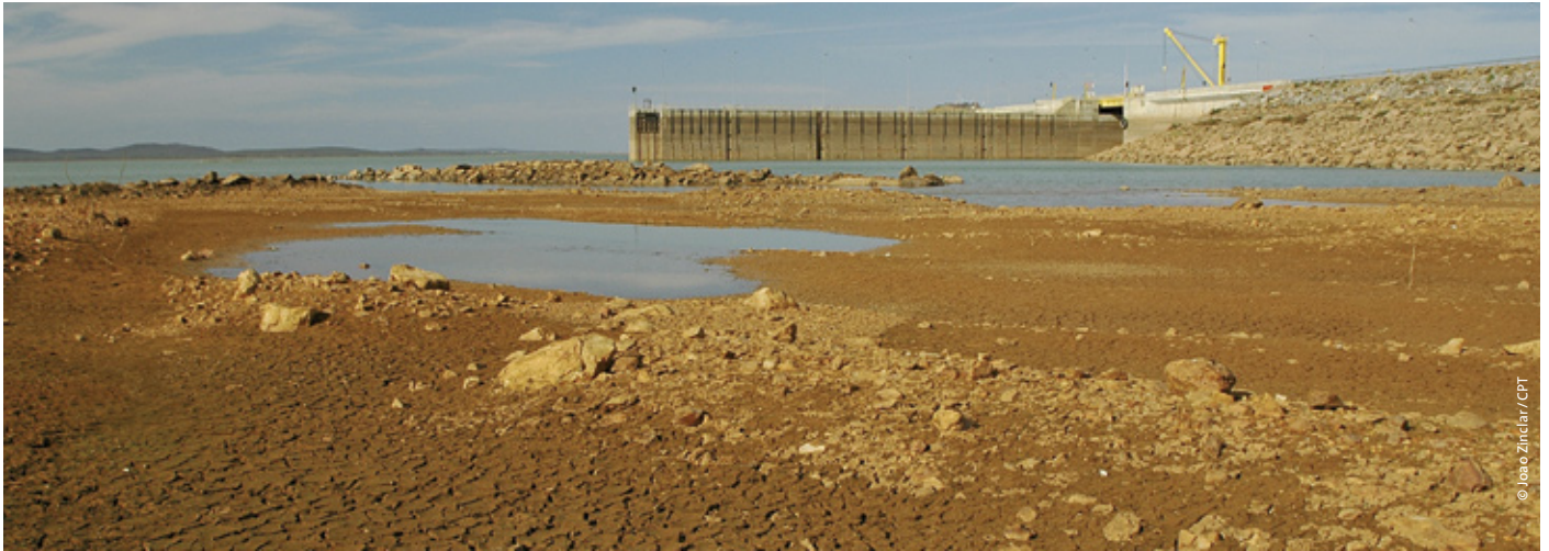
Die ungebremste Abholzung im Quellgebiet des Rio São Francisco (Brasilien) trocknet den Fluss und den Sobradinho-Stausee immer stärker aus

»Ein Brandopfer von unrechtem Gut ist eine befleckte Gabe, Opfer des Bösen gefallen Gott nicht. Kein Gefallen hat der Höchste an den Gaben der Sünder, auch für eine Menge Brandopfer vergibt er die Sünden nicht. Man schlachtet den Sohn vor den Augen des Vaters, wenn man ein Opfer darbringt vom Gut der Armen. Kärgliches Brot ist der Lebensunterhalt der Armen, wer es ihnen vorenthält, ist ein Blutsauger. Den Nächsten mordet, wer ihm den Unterhalt nimmt, Blut vergießt, wer dem Arbeiter den Lohn vorenthält.« (Jes Sir 34,21–27)