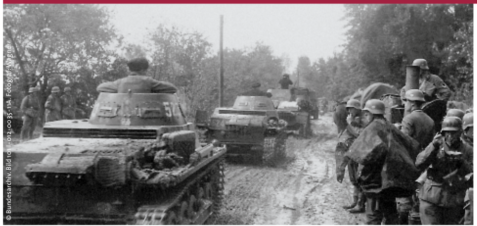
Die Deutsche Wehrmacht beim Einmarsch in Polen nach dem Überfall am 1. September 1939, der den Beginn der 2. Weltkriegs markiert

Birgit Wehner Sprecherin von pax christi Limburg