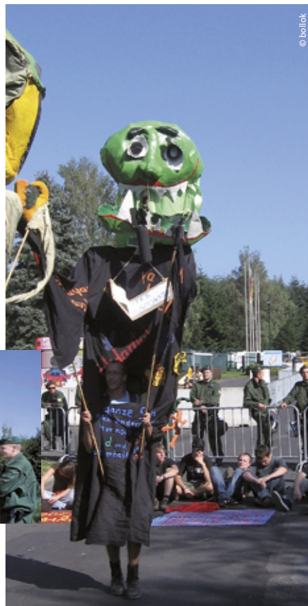
Riesenspuppen vor dem Luftwaffenstützpunkt Büchel: Demonstration gegen die dort stationierten Atomwaffen im August 2008