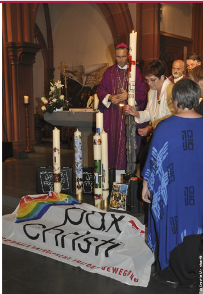
Bischof Franz-Peter segnete die fünf Friedenskerzen, die bis 18. November 2009 durch das Bistum wandern

Gemeinsam mit dem Bischof und dem geistlichen Beirat Pfarrer Rolf Glaser konzelebrierten Priester aus verschiedenen Ländern, die von Deutschland mit Krieg und Gewalt überzogen worden waren. Darunter waren polnische, ukrainische, französische, kroatische und slowenische Geistliche. Als konkretes Beispiel für den Widerstand gegen das NS-Regime und die Kraft, die der Glaube verleihen könne, erinnerte Bischof Franz-Peter an das Wirken des polnischen Bischofs Ignacy Je, der in