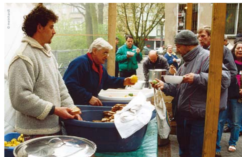
Franziskanische Suppenküche in Berlin

Der Winter hält uns lange im Griff – dieses Jahr. Doch: Ob mit oder ohne Klimaveränderung wissen wir, es wird Frühling. Auch wenn ich es kaum glauben kann angesichts des politischen, wirtschaftlichen und auch kirchlichen Klimas derzeit.