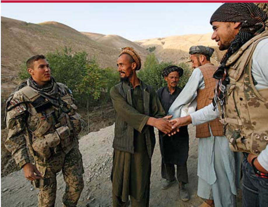
Bundeswehrsoldat im Einsatz fern der Heimat