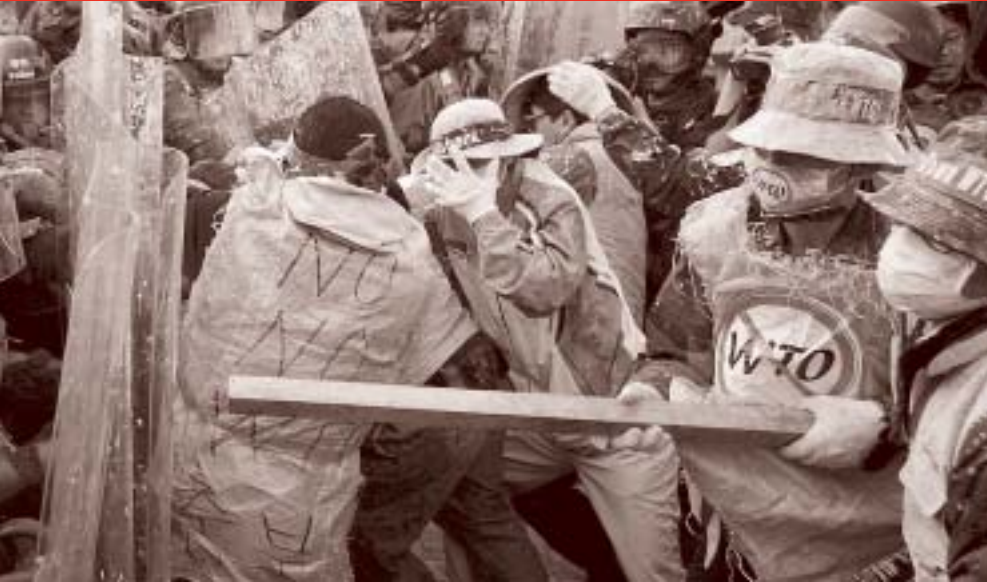
gegen die WTO-Tagung im Dezember 2005 in Hong Kong.

Der Washington Konsensus (1990) ist ein vom amerikanischen Wirtschaftswissenschaftler John Williamson geprägter Begriff, der ein komplexes politisches Programm beschreibt. Dieses Wirtschaftsprogramm soll zu mehr makroökonomischer Stabilität führen und staatlichen Protektionismus abbauen. IWF (Internationaler Währungsfonds) und Weltbank diente dieses Programm ebenso als »Blaupause« wie internationalen Finanzinstitutionen und Beratungsfirmen. Wegen seiner »verheerenden« Wirkungen auf die hoch verschuldeten Entwicklungsländer ist diese Programmatik vor einigen Jahren um die Komponenten der Armut- und Umweltpolitik ergänzt worden. Aus diesem Grund spricht man heute schon von einem Post-Washington-Konsens.