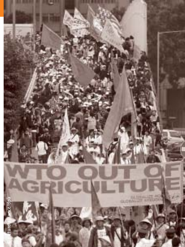
Demonstration von »Globalisierungsgegnern« bei der WTO-Tagung in Hong Kong

greift, dann kommt gerade der Absicherung von Eigentumsrechten eine herausragende Bedeutung zu. Schon der Washington Konsensus hatte deshalb die Eigentumsгарантиen zu einem zentralen Programmpunkt erklärt. Im Rahmen der WTO wird dem geistigen Eigentum eine besondere Aufmerksamkeit geschenkt. Verständlich ist dies vor dem Hintergrund von Produktpiraterie, wodurch den nationalen Volkswirtschaften, wie den betroffenen Unternehmen, Milliarden-schäden entstehen. Das sogenannte TRIPS-Abkommen regelt unter anderem den Patentschutz und die Aneignung von kollektivem Wissen. Wie problematisch die Regelungen des TRIPS jedoch sind, wird an den Medikamenten deutlich, die gegen HIV/Aids, Malaria und Tuberkulose entwickelt wurden. Aufgrund des Patentschutzes werden sie nur gegen hohe Preise abgegeben, so dass sie für viele Länder schlichtweg zu teuer sind. Ebenso verhält es sich mit dem »Nachbau« dieser Produkte (Generika) und der Lizenzvergabe. Auch hier nutzen internationale Pharmakonzerne ihre Vormachtstellung und ihre große ökonomische Potenz aus, um ihre Monopole aufrechtzuerhalten. Problematisch ist zudem die Patentierung von Produkten, deren Lizenzfristen abgelaufen sind und die nur leicht verändert (ohne Veränderung der Wirkung) auf den Markt gebracht werden. Dabei ist es offensicht-