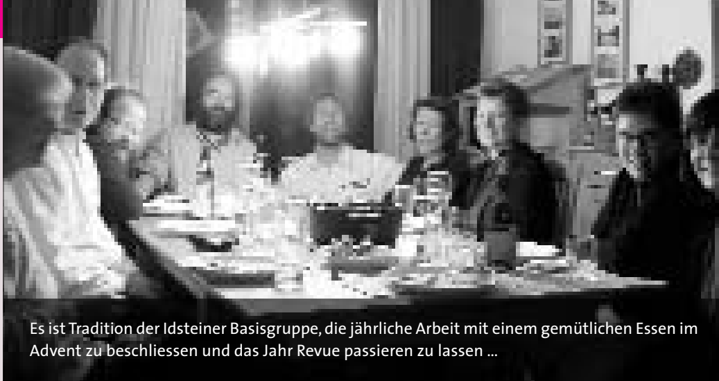
Es ist Tradition der Idsteiner Basisgruppe, die jährliche Arbeit mit einem gemütlichen Essen im Advent zu beschliessen und das Jahr Revue passieren zu lassen ...

stein. Anmeldung und nähere Informationen finden Sie im beiliegenden Faltblatt. Kontakt und Leitung: Thomas Wagner, Tel.: 0 64 31/ 2 95-38 6 oder -32 8.