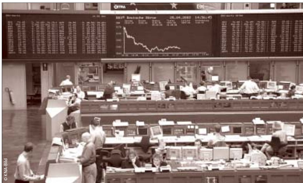
Deutsche Börse in Frankfurt am 25. April 2002.

Auffallend ist, dass die Krisen sich vor allem in den Ländern und Regionen ereignen, die zu den so genannten Schwellenländern gezählt werden. Des Weiteren fällt auf, dass es noch nie so viele Finanzkrisen gegeben hat wie in den letzten 15 Jahren. Der Verdacht liegt nahe, dass dies mit der Deregulierung der Finanzmärkte zu tun hat. Wie solche Finanzkrisen sich ereignen, welche Ursachen sie haben und welche Wirkungen sie erzeugen, soll am Beispiel der Asienkrise von 1997 erläutert werden. Bis kurz vor Ausbruch der Krise im Juli dieses Jahres galten die asiatischen Tigerstaaten Malaysia, Indonesien, Südkorea, Thailand und Philippinen als die Wachstumsregion überhaupt, in der man