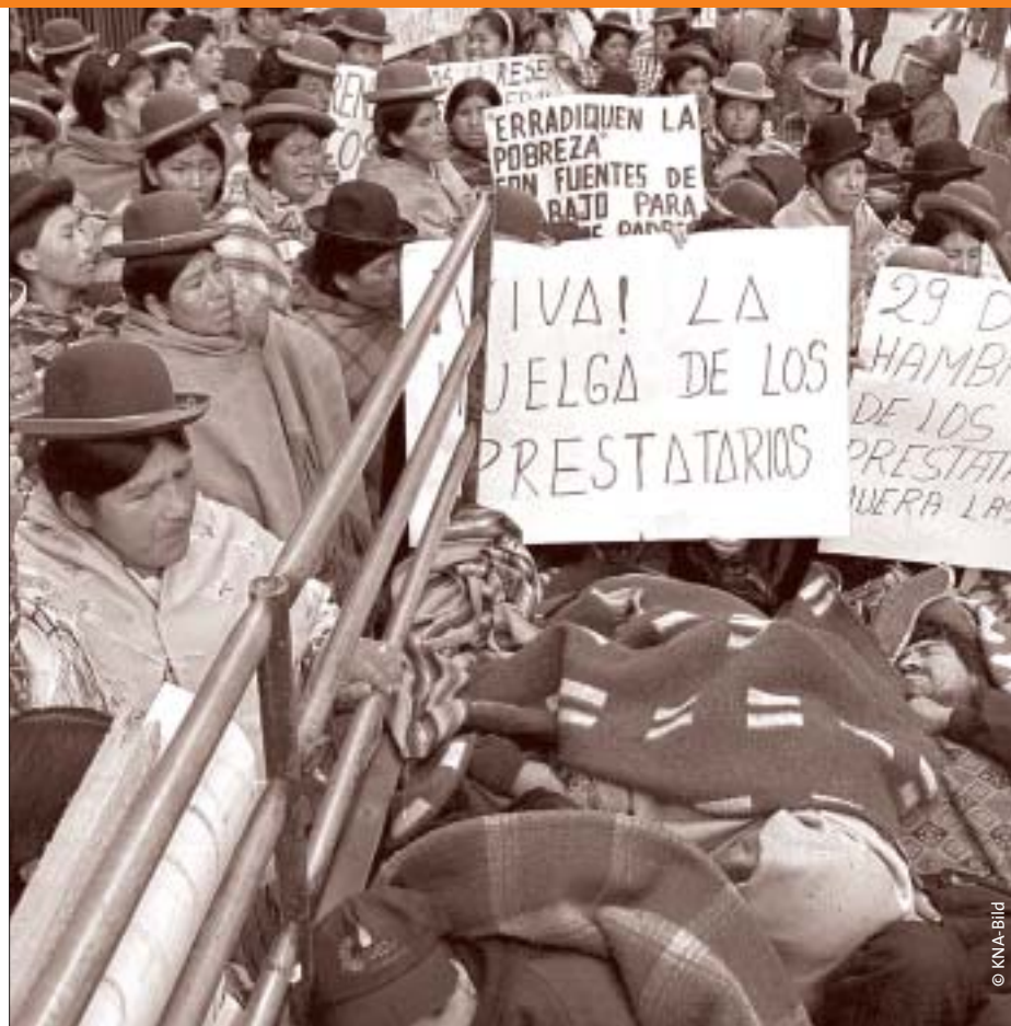
Indios und Hunderte Schuldner demonstrieren am 21. September 1999 mit einem Hungerstreik vor der Spar- und Darlehensgesellschaft »Financiera Accesso« in La Paz gegen die hohen Zinsen und fordern den Erlass ihrer Schulden.

Doch nicht nur die Entwicklungs-, Schwellen- und Transformationsländer sind von dem internationalen Finanzmarkt betroffen, sondern selbst so starke Ökonomien wie die Deutschlands. Denn die Renditeerwartungen auf den Finanzmärkten geben inzwischen auch die Messlatte für die Rendite vor, die die Anleger auch bei Industrie-, Handels- und Dienstleistungsfirmen erwarten. Dabei interessiert die institutionellen Anleger nicht in erster Linie der langfristige Erfolg eines Unternehmens, ihr Interesse richtet sich vielmehr auf die kurz-