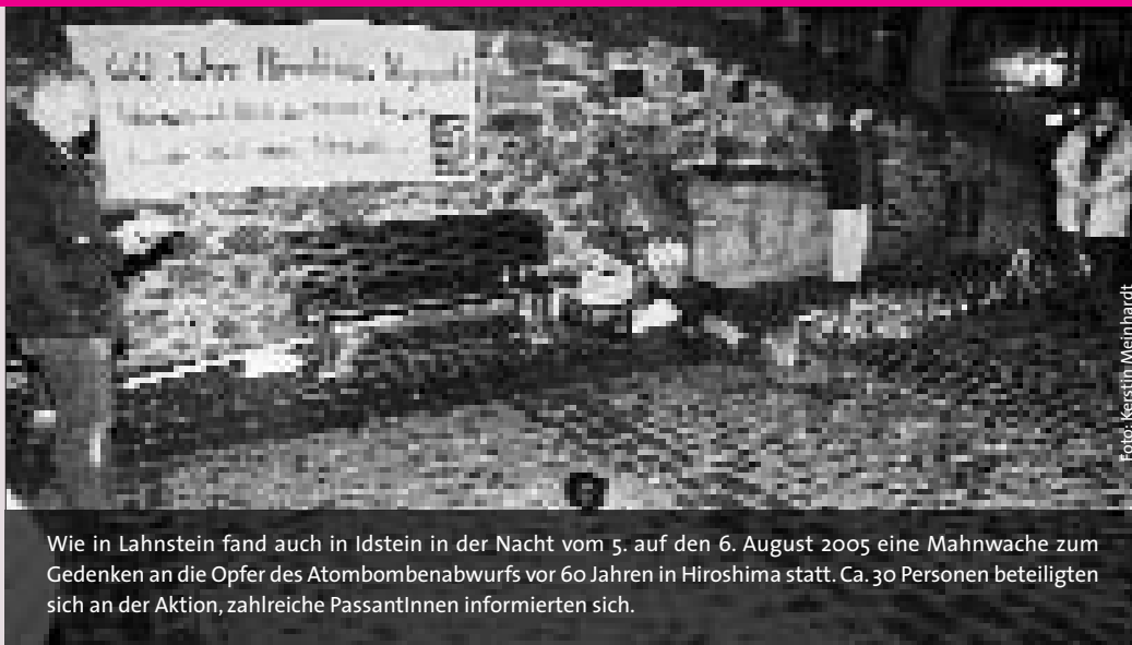
Wie in Lahnstein fand auch in Idstein in der Nacht vom 5. auf den 6. August 2005 eine Mahnwache zum Gedenken an die Opfer des Atombombenabwurfs vor 60 Jahren in Hiroshima statt. Ca. 30 Personen beteiligten sich an der Aktion, zahlreiche PassantInnen informierten sich.