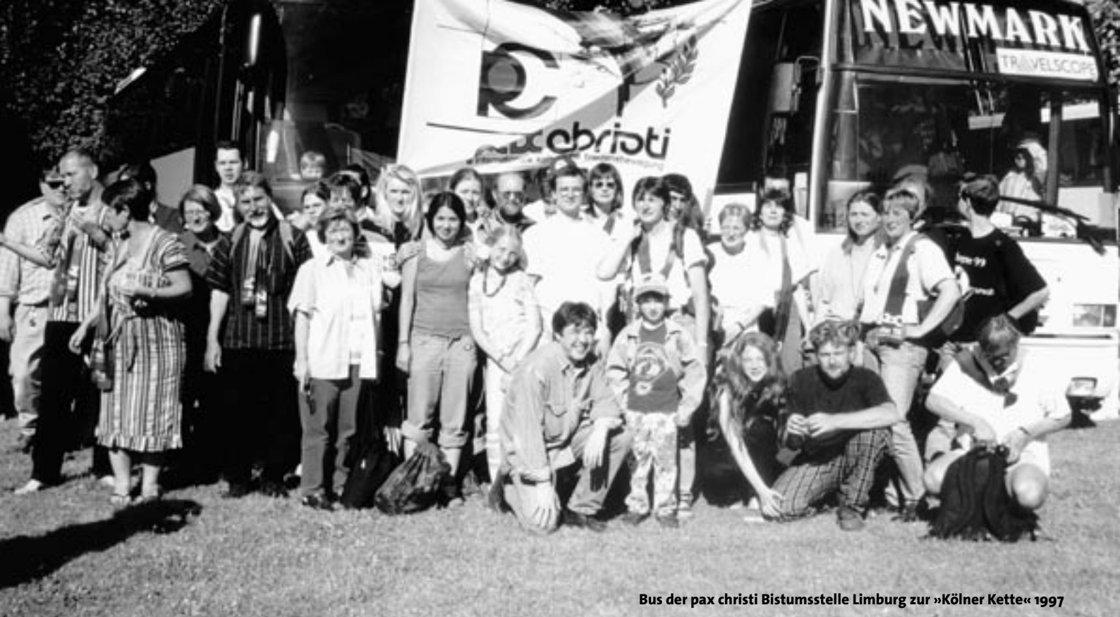
Bus der pax christi Bistumsstelle Limburg zur »Kölner Kette« 1997