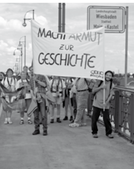
Der Ökumenische Pilgerweg Rhein-Main, im Jahre 2005, überquert die Theodor-Heuss-Brücke zwischen Mainz und Wiesbaden