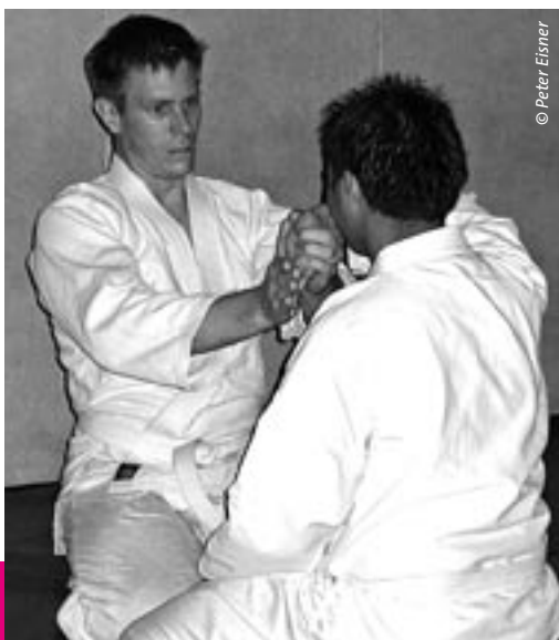
Die japanische Kampfkunst Aikido ist Teil der Friedensarbeit auf der Insel Negros