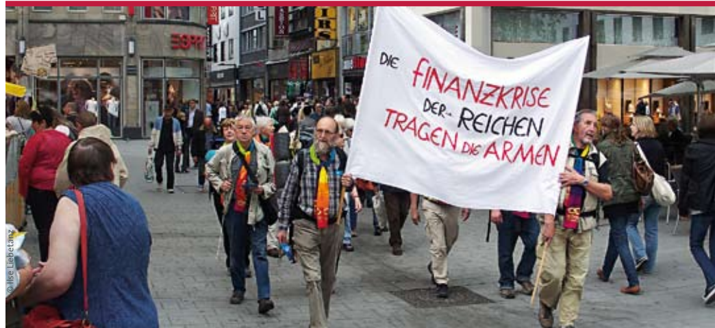
In kleinen Schritten gemeinsam zum Schalom: Mitglieder von pax christi Limburg auf dem ökumenischen Pilgerweg im Juni in Köln

P.S.: So zahlreiche und durchweg positive Reaktionen wie auf unser neues Zeitschriften-Outfit erhielten wir noch nie!