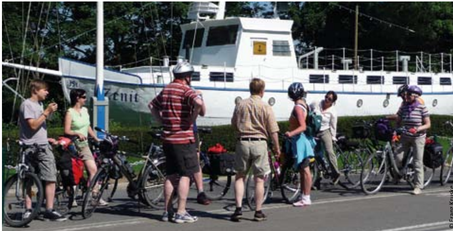
Radeln am Rhein: Friedenswege-Radtour 2009 bei bestem Wetter