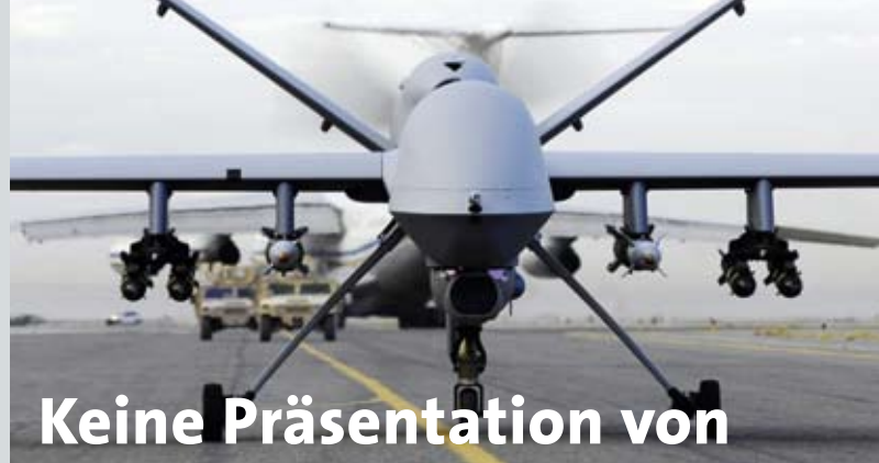
Das unbemannte Flugobjekt »MQ-1 Predator« der US-Luftwaffe

Realisierung: G meinhardt • www.meinhardt.info • September 2010