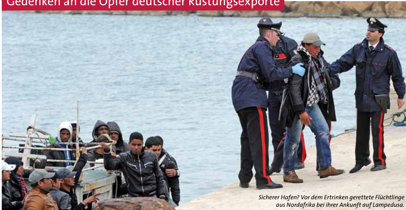
Sicherer Hafen? Vor dem Ertrinken gerettete Flüchtlinge aus Nordafrika bei ihrer Ankunft auf Lampedusa.

Frühjahr 2011 – in Nordafrika kämpft ein brutaler Diktator um seinen Machterhalt und scheut nicht den Einsatz massiver Waffengewalt gegen sein eigenes Volk. Der »Arabische Frühling«, der in Tunesien und Ägypten und weiteren Staaten des Nahen Ostens die Demokratiebewegung erblühen lässt, scheint auch Libyen, Syrien und den Jemen ergriffen zu haben.